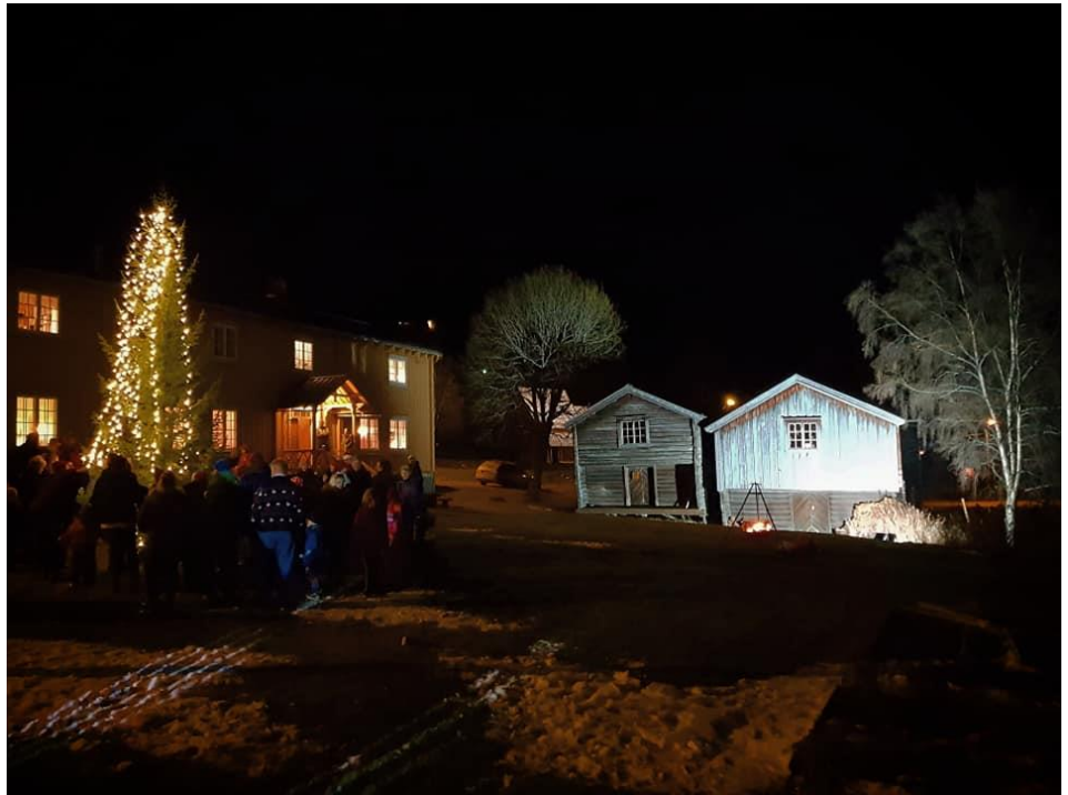
Arkivfoto fra julegrantenning i Gammelgården i Haltdalen. Gammelgården er Holtålen kommunes tusenårssted, og nærmeste nabo til Haltdalen nye stavkirke.

Jeg kan blant annet nevne ferdigstillelsen av den nye arealdelen til kommunen, som jeg vet også eiere av fritidsboliger går og venter på.