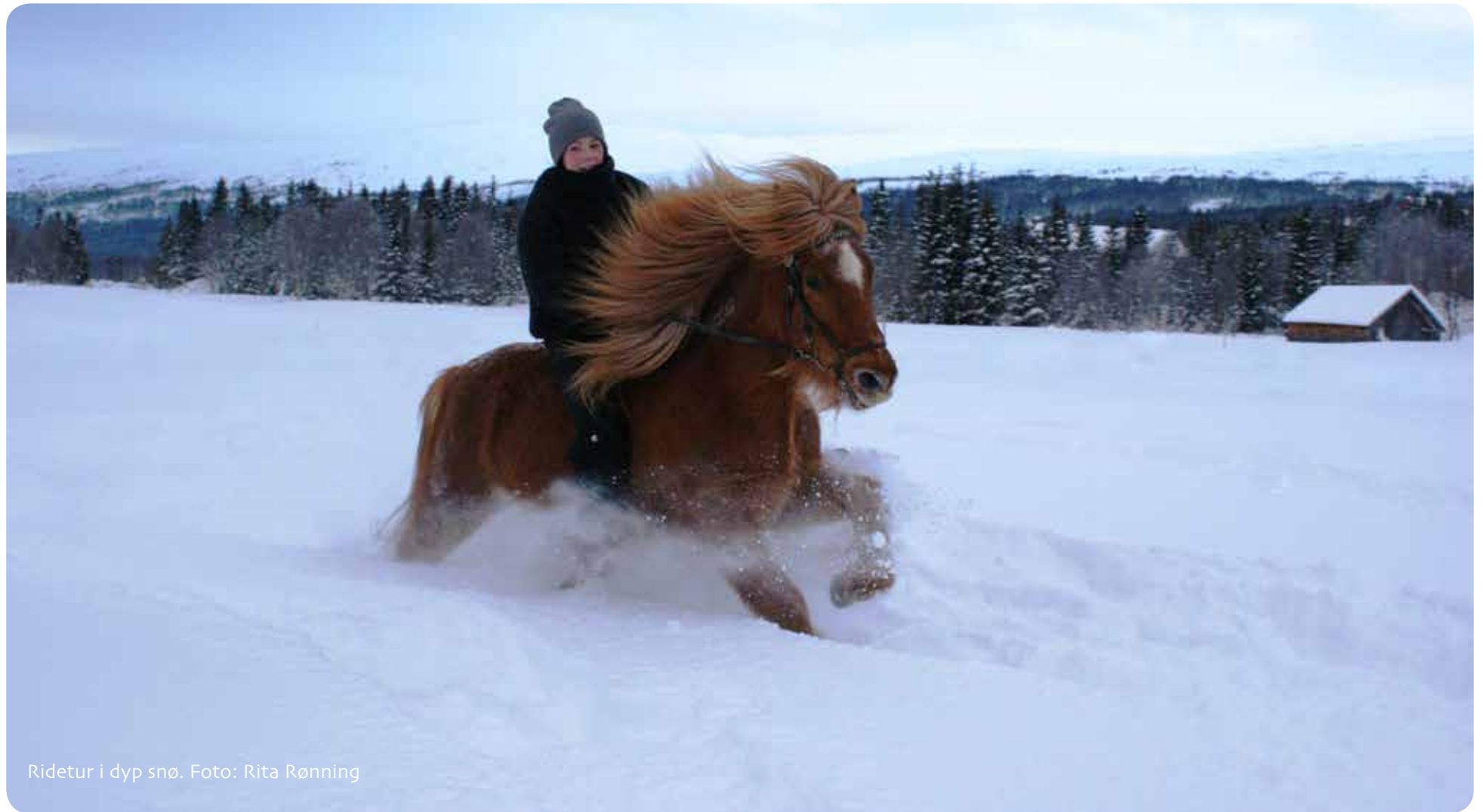
Ridetur i dyp snø.