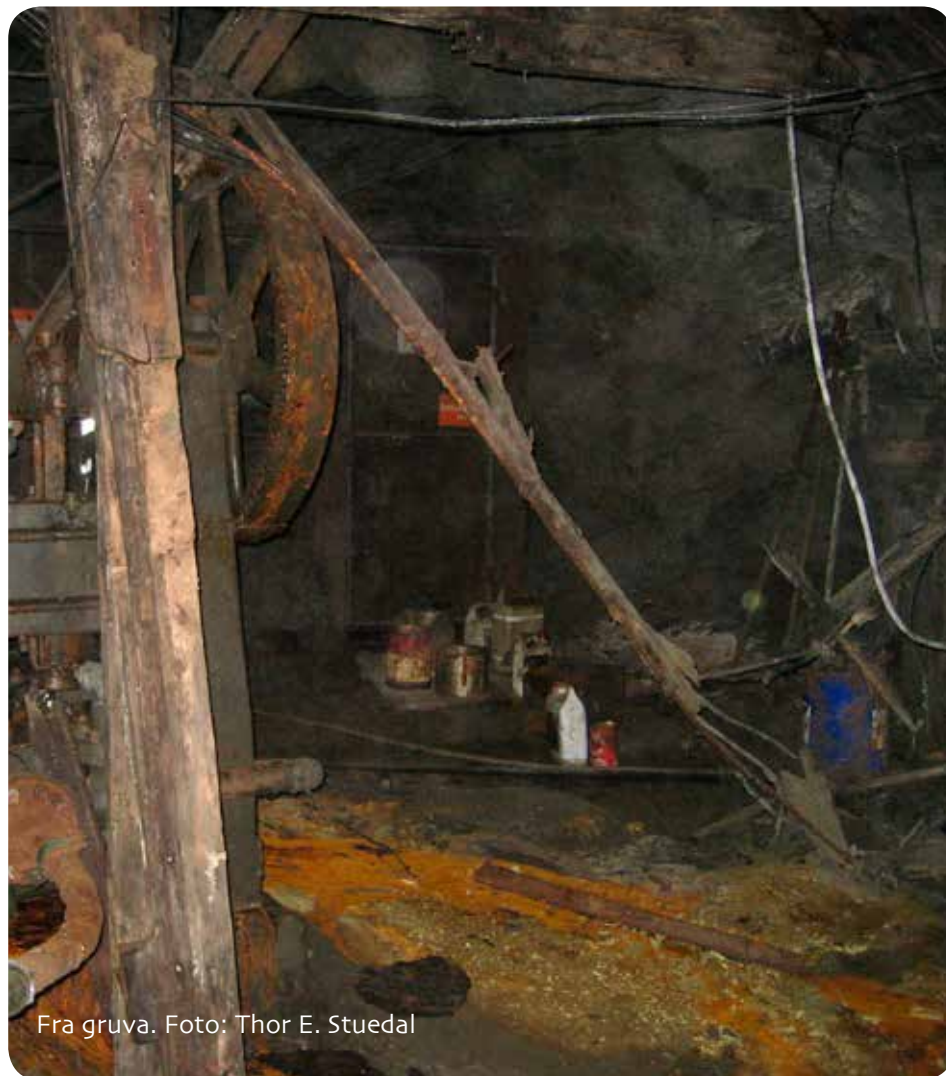
Fra gruva.

Holtålen kommune er en liten kommune med begrensede ressurser administrativt. Det bør derfor legges opp til at en næringsplan er håndterbar mht. arbeidsmengde når en skal jobbe med konkrete tiltak som krever oppfølging. Det er viktig at det legges opp til å få gode og oppnåelige mål med tilhørende strategier og tiltak.